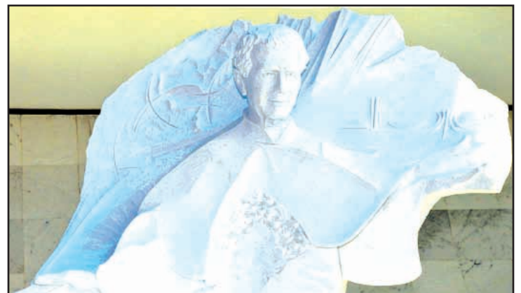
Brasilia. A new statue for Don Bosco in Brasilia's cathedral. The saint had foreseen the city in a vision. / Don Bosco avait "rêvé" cette ville du Brésil alors que ce n'était que forêt.