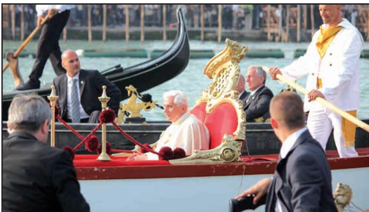
Venise. Le Pape Benoît XVI en visite pastorale à Venise il y a quelques mois. / Pope Benedict on apostolic visit to Venice.

The trip began amid predictions of disaster, including proposals from high-profile atheists and human rights activists to slap handcuffs on the pontiff for his role in the sexual abuse crisis. Yet in the end, Benedict led what amounted to