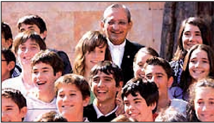
Rome. Le leadership mondial de la Congrégation n'empêche pas Don Pascual Chavez de se trouver bien avec les jeunes. / Even if taken up by his responsibilities as Superior General, Don Chavez finds time to be with young people.

relation avec l'enseignant, non respect des rythmes d'acquisition et d'apprentissage ...).