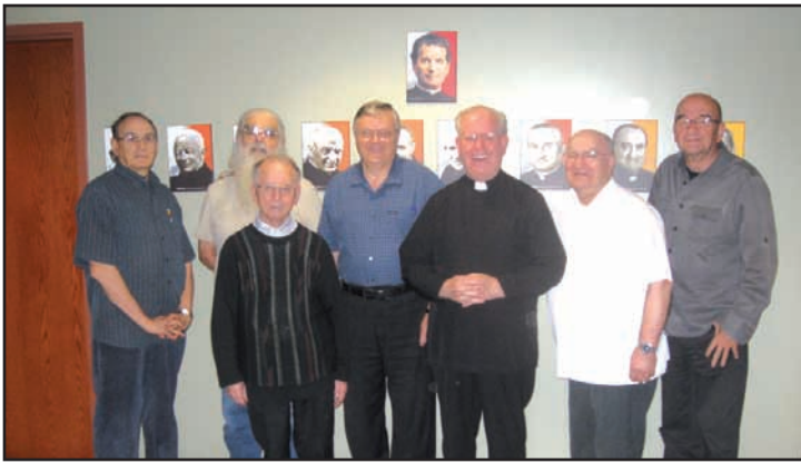
Montréal. La communauté salésienne de Montréal. / The Salesian community of Montreal.