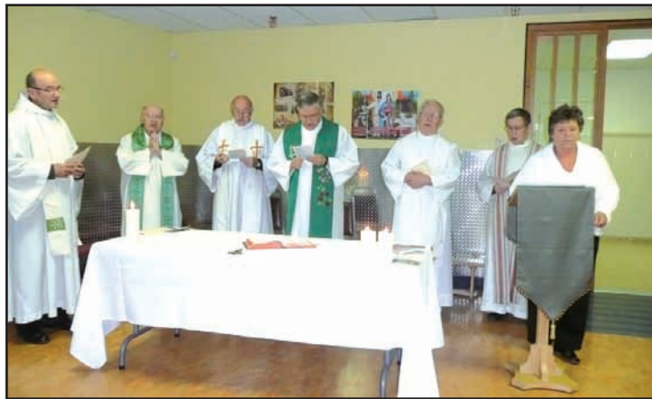
Montreal. The day closed with the celebration of the Eucharist. / L'eucharistie clôture la journée d'étude et de mini-retraite.