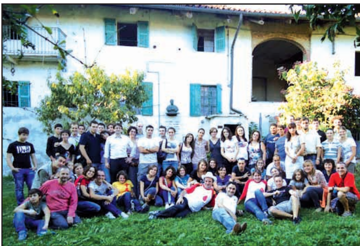
Villa Moglia. Une association de jeunes fait l'achat d'une maison de ferme comme centre de rencontres où Jean Bosco passa 2 ans de sa jeunesse à travailler. / Don Bosco Youth Association buys the farm house where young John Bosco spent 2 years of his youth working.