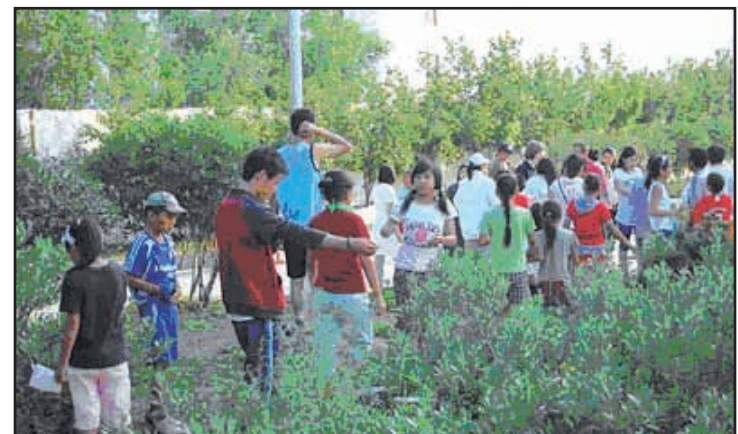
Mongolie. Les enfants de l'oratoire salésien de Darkham sont quotidiennement engagés dans les activités d'été organisées par les missionnaires vietnamiens. / Young missionaries from Vietnam organise summer activities for children at Salesian Oratory, most of them non Christians.