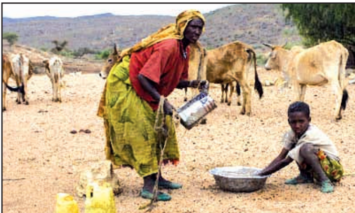
Éthiopie. Après grand tapage médiatique, le monde semble avoir oublié la famine qui sévit en Éthiopie. Les salésiens y dirigent 11 œuvres. Les salésiennes sont présentes aussi. / Has the world forgotten about the famine in Ethiopia? The Salesians have 11 centres there; the Salesian Sisters are also present.