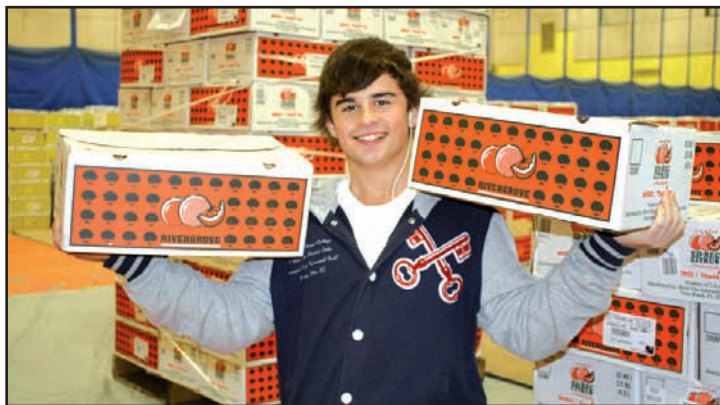
Sherbrooke. À sa 31 e année, la levée de fonds au Salésien par la vente d'agrumes (plus de 10 000 caisses). / Again this year, 5 vans of juicy fruits from Florida to subsidize student activities.

La confiance c'est le principe méthodologique de la pédagogie salésienne. En manifestant d'emblée sa confiance vis-à-vis de chaque jeune accueilli, l'éducateur lui permet de reprendre confiance en lui-même, condition indispensable pour être à son tour capable de faire confiance. L'instauration de cette relation de confiance n'est possible que si le jeune se sent accueilli, avec ses richesses et ses difficultés. « Sans