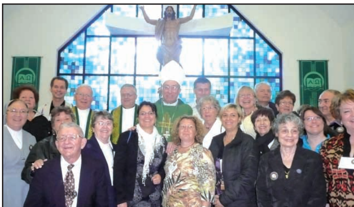
Stony Point, N.Y. La délégation canadienne des Coopérateurs Salésiens à l'eucharistie de clôture du congrès du secteur nord-américain de la Région interaméricaine, entourant le Cardinal Oscar Rodriguez, sdb, du Honduras. / The Salesian Cooperators from Canada with Salesian Cardinal Rodriguez at North American Congress.