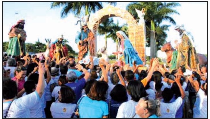
Salvador, Brésil. Une crèche de Noël a été construite sur l'une des routes principales de la ville par les jeunes d'une école salésienne. / On November 28, a large Christmas crib was put up on one of the main roads of the city; it was made by the Dom Bosco Salesian High School.