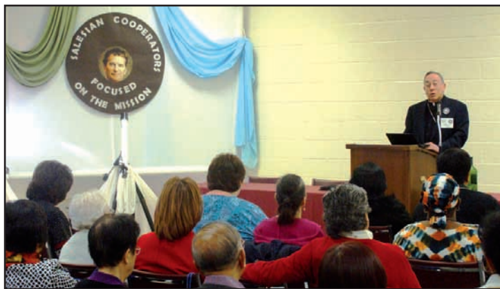
Stony Point, N.Y. Cardinal Oscar Maradiaga Rodriguez addresses Salesian Cooperators. / Le Cardinal Rodriguez a passé tout le weekend avec les congressistes. Son intervention principale portait sur La Mission Continentale , s'inspirant des documents d'Aparecida.