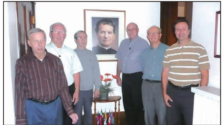
Sherbrooke. La communauté salésienne de Sherbrooke. / The Salesian community of Sherbrooke.